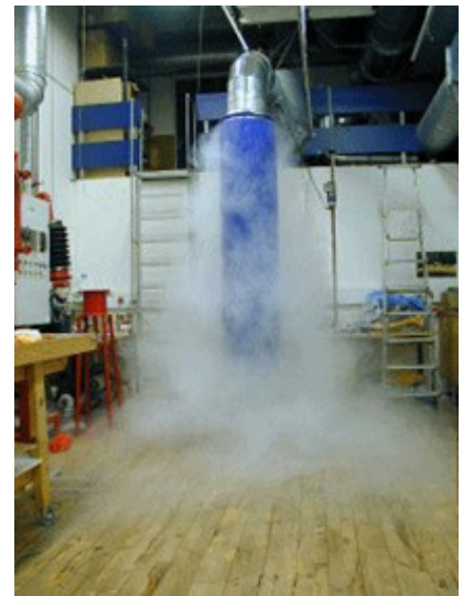
Röktest som demonstrerar deplacerande ventilation från vertikala don