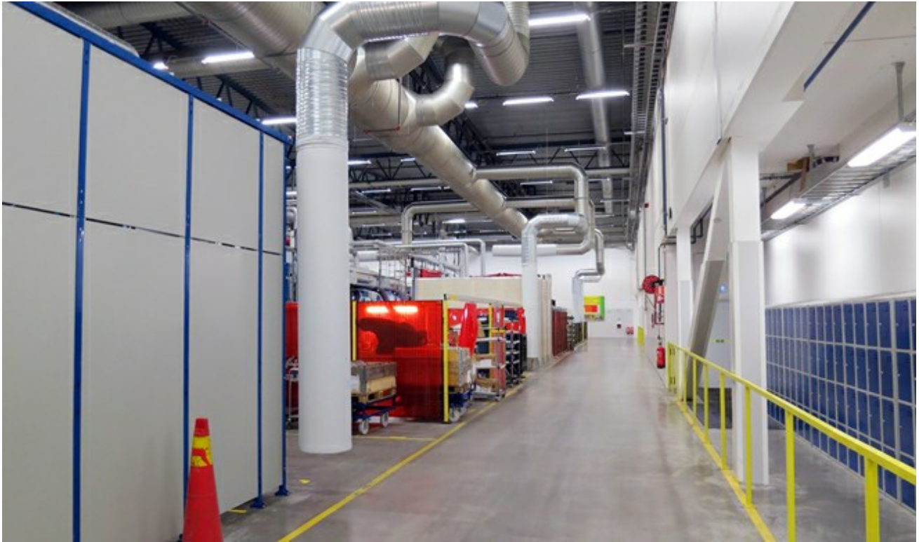
Runda vertikala injektdon i industrilokal