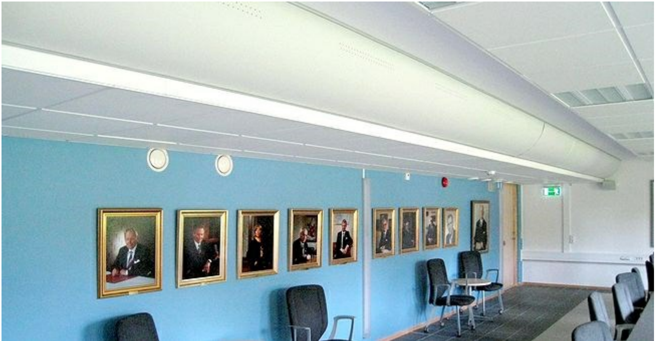
Konferensrum, Stadshuset Ängelholm

Textildonen kan antingen vara i färg för att framhäva ett företags profil eller göras i diskret ljusgrått eller vitt utförande. Ett kvartsrunt don i takvinkel försvinner snyggt in i interiören samtidigt som det tillför stora mängder undertempererad tilluft helt dragfritt.