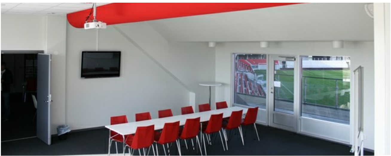
Guldfågeln Arena, Kalmar