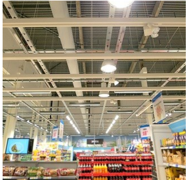
City Gross, Borås

Donens storlek och färg anpassas också efter lokalens förutsättningar och kundens önskemål. De kan antingen smälta in i miljön och gömmas eller framhävas med en kontrastfärg eller valfri profolfärg.