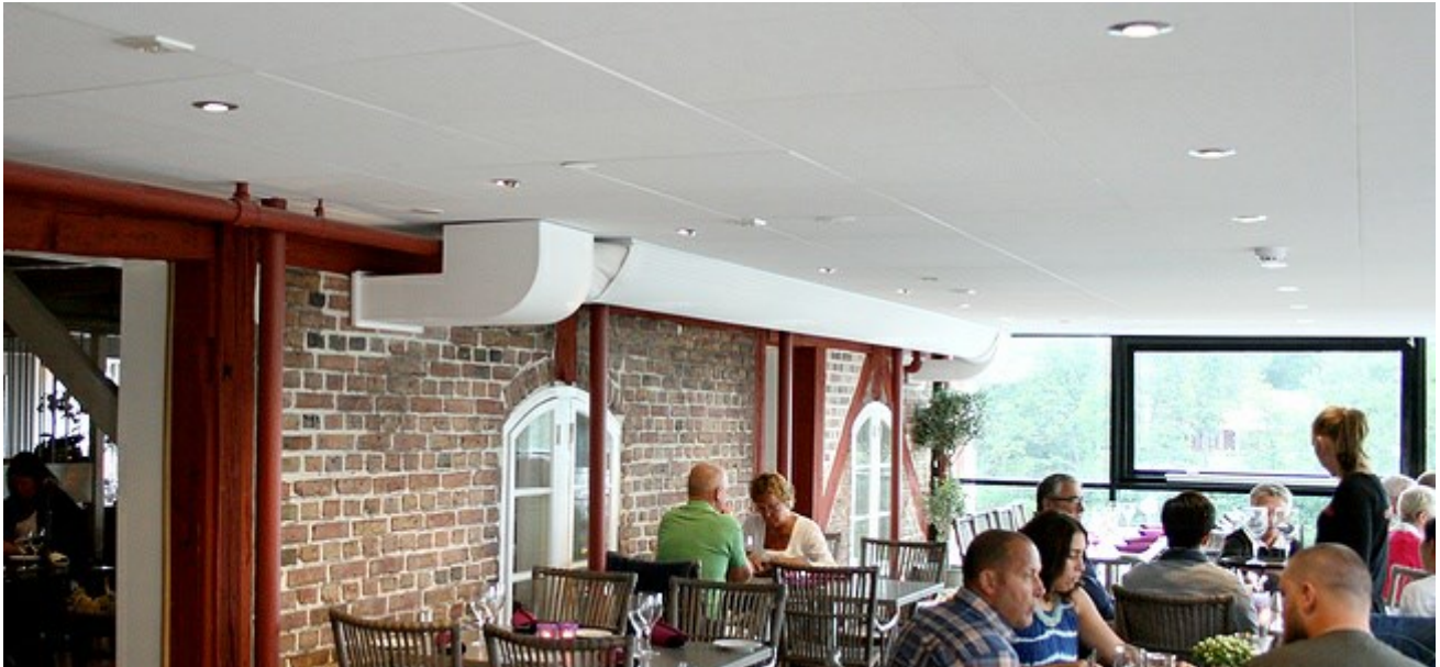
Restaurang Gustaf Bratt Falkenberg