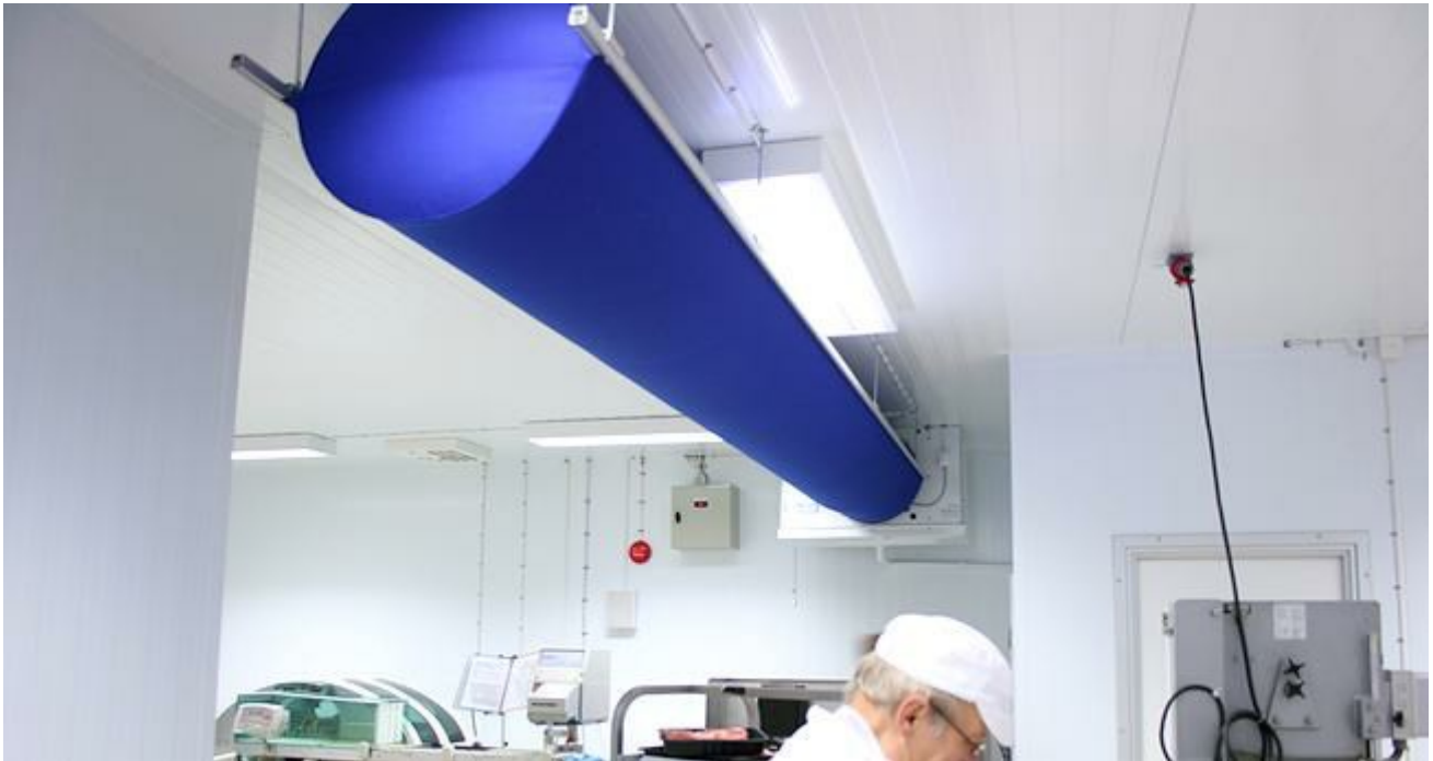
City Gross Helsingborg