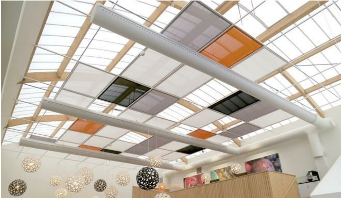
Ljusgrå dysdon smälter in i de flesta lokaler, även i stora dimensioner

Genom att ventilera lokalerna genom textildon kombinerar man snyggare inomhusmiljöer med de bästa tekniska lösningarna.