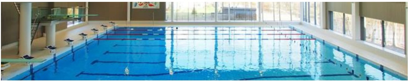
Stora vita halvrunda don i taket smälter in i simhallen och håller fönstren kondensfria