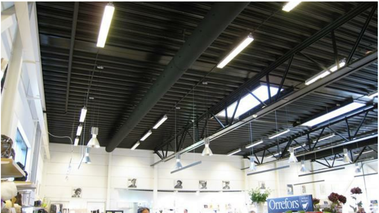
Svarta don försvinner nästan helt mot svarta innertak

Du kan se gott om exempel i vårt galleri med referenser . Dessutom finns våra broschyrer och kataloger i onlineformat . Du hittar även våra tidigare nyhetsbrev med cases som kan hjälpa dig med idéer till de projekt du jobbar med just nu.